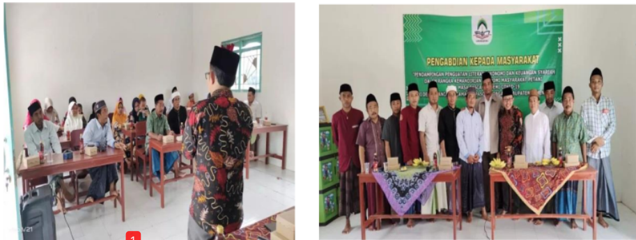
1 Gambar 2. Dokumentasi Kegiatan Pengabdian Kepada Masyarakat